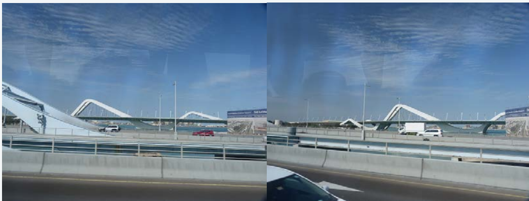
Fig. 3-4 Puente de Zaha Hadid en Abu-Dhabi.

Desde aquí, una escuela de Arquitectura del mundo, nuestro respeto y nuestro sentir por una ausencia que nos deja huérfanos de futuros proyectos que salgan de su genio y su pluma.