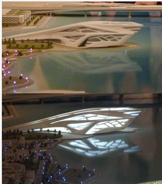
Fig. 1-2 Proyecto para la Isla de los Museos, en Abu-Dhabi.

Ha muerto en Miami, el jueves 31 de marzo de 2016, Zaha Hadid, la mujer fuerte, la arquitecta sorprendente, que supo camelar un mundo de hombres con la materialidad de sus formas arquitectónicas. “Tratando de romper los límites de la arquitectura”, como ella decía, hablando de convertir los edificios en paisaje y de repensar los límites físicos de las construcciones.